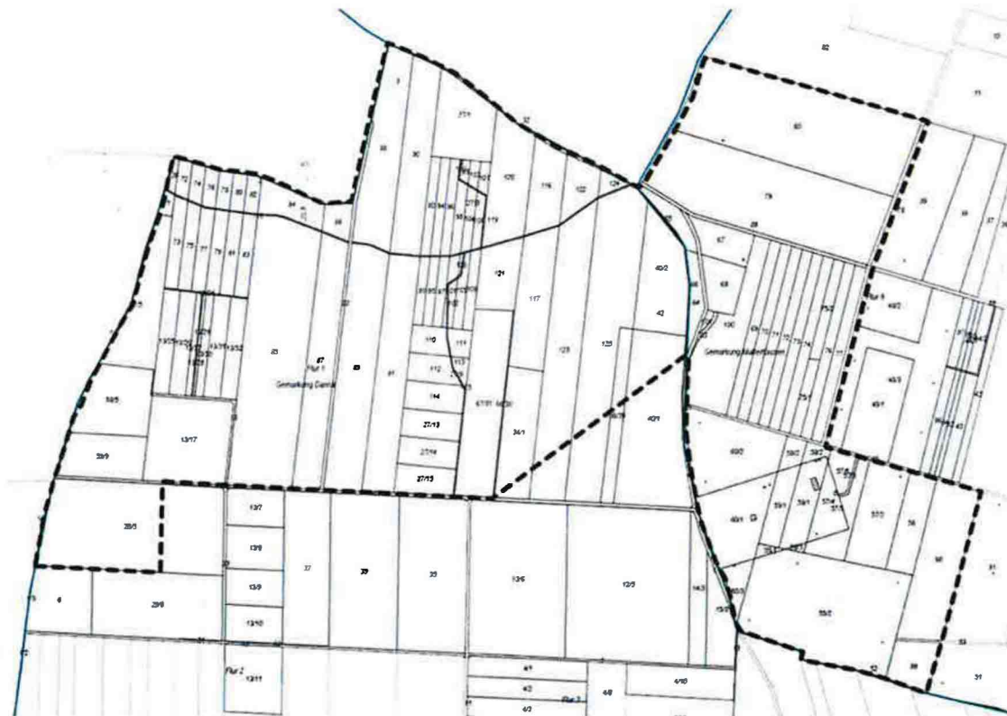
Abbildung 1: Geltungsbereich der Aufhebung des Bebauungsplans auf ALKIS Grundlage