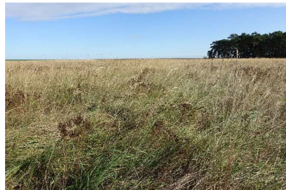
Abbildung 12: Grünlandbrache (ID 02)