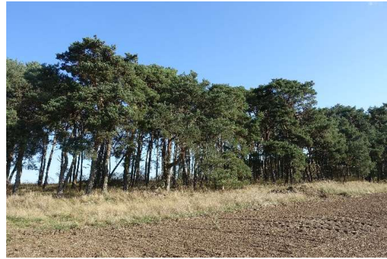
Abbildung 4: Südliche Waldkante