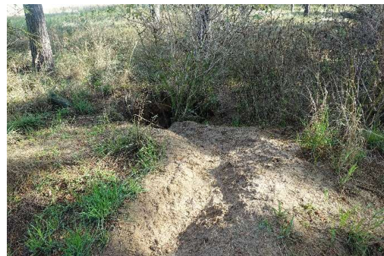
Abbildung 14: Tierbau innerhalb der Forstfläche (vermutlich Dachs)