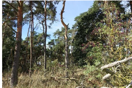
Abbildung 6: Holunder-Kiefern-Forst, im Osten des UG (ID 03)