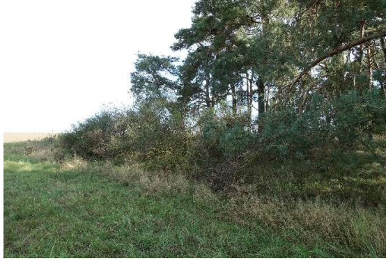
Abbildung 9: Vergreister Besenginster an der westlichen Waldkante (ID 05)