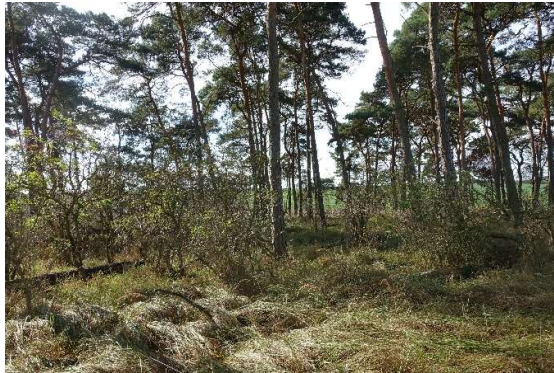
Abbildung 5: Holunder-Kiefern-Forst, im Westen des UG (ID 03)