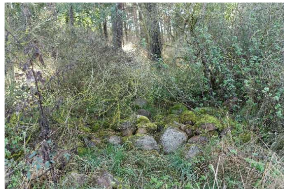
Abbildung 8: Beschatteter Lesesteinhaufen an der nördlichen Waldkante (ID 07)