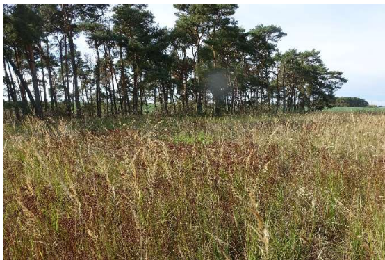
Abbildung 13: Grünlandbrache (ID 02) und nordwestliche Waldkante (ID 03)