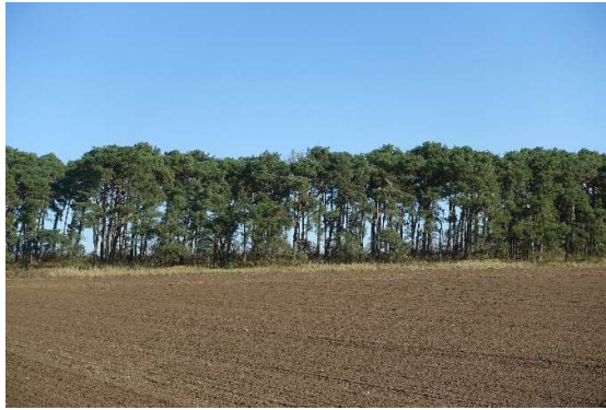
Abbildung 3: Blick von Süden auf das UG (Acker: ID 04)