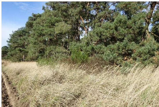
Abbildung 11: Besenginster an der südlichen Waldkante (ID 10)