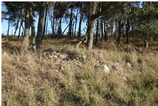
Abbildung 7: Linear angelegter Lesesteinhaufen (ID 06)