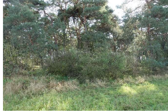
Abbildung 10: überalteter Besenginster (ID 05)