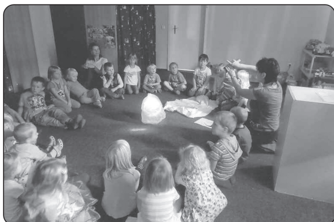
Wir lernen die Atmosphäre kennen