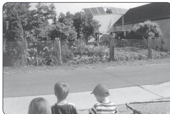
Auf der Suche nach erneuerbaren Energien