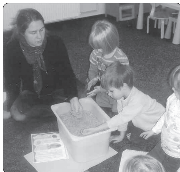
Woraus besteht Papier und wie wird es hergestellt?