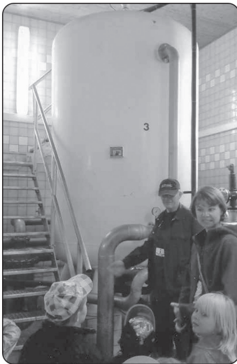
Besuch im Wasserwerk in Blönsdorf