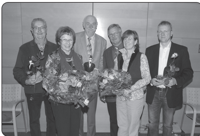
(Text und Foto: Pressestelle des Landkreises Teltow-Fläming)

Traditionell werden durch den Landkreis Teltow-Fläming Bürgerinnen und Bürger für ehrenamtliches Engagement gewürdigt. Dazu fand am 10. Dezember 2013 eine Feierstunde im Kreishaus Luckenwalde statt. Landrätin Kornelia Wehlan und Kreistagsvorsitzender Christoph Schulze würdigten die Leistungen der Ehrenamtler, deren Einsatz nicht mit Geld aufzuwiegen sei. Egal, in welchem Bereich der Gesellschaft sie sich engagierten - ohne ihre (ehrenamtliche) Arbeit wäre unsere Gesellschaft sehr viel ärmer. Deshalb sei es im Landkreis Teltow-Fläming zu einer schönen Tradition geworden, den Internationalen Tag des Ehrenamts zum Anlass für eine kleine Feierstunde zu nehmen. Insgesamt 73 Bürgerinnen und Bürger waren von ihren Bürgermeistern bzw. dem Amtsdirektor für eine Würdigung aus Anlass des Tages des Ehrenamts vorgeschlagen worden. Außerdem weilten weitere 13 Frauen und Männer unter den Gästen, die sich ehrenamtlich im Bereich der Seniorenbetreuung engagieren. Sie waren durch die Wohlfahrtsverbände vorgeschlagen worden. Alle wurden mit einer Urkunde und einem kleinen Präsent geehrt sowie zu einem kleinen Imbiss in gemütlicher Atmosphäre eingeladen.