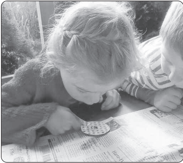
Kann ein Wassertropfen zur Lupe werden?