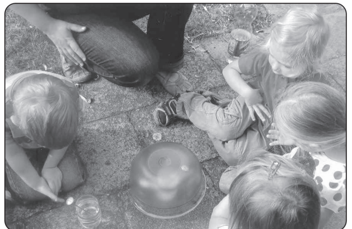
Ein Experiment zum Treibhauseffekt