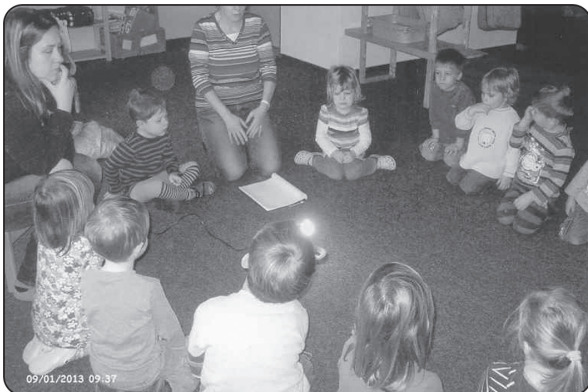
Wie kommt der Strom aus der Steckdose?