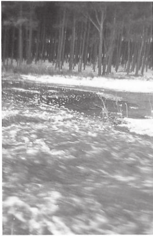
Überschwemmte Wiese am Wald neben dem Milchkutscherweg

Aufnahmen vom Hochwasser des Frühjahres 1940