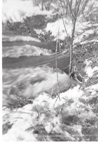
Schmelzwasser am Bacheinlauf gegenüber dem Wollberg

Fotos des Hochwassers aus dem Frühjahr 1947 standen mir leider nicht zur Verfügung. In loser Folge möchte ich die Hoch- und Wasserstände, wie sie mir bildlich vorliegen, und die Veränderungen in Jahresabschnitten hier darstellen.