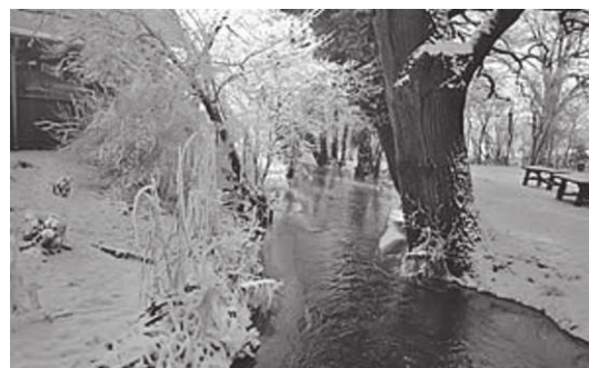
Der Zahnabach bei Külso 2000 (1)

Aber auch Unheil kann der Zahnabach über seine Anwohner bringen. Bei plötzlichem Tauwetter nach schneereichen Wintern führt er so viel Wasser vom Hohen Fläming herab, dass das Wiesental weithin überschwemmt wird.