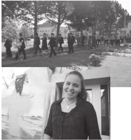
Wir haben eine Sozialarbeiterin!