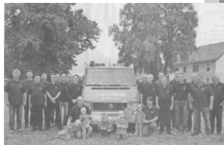
135 Jahre FFW Mellnsdorf