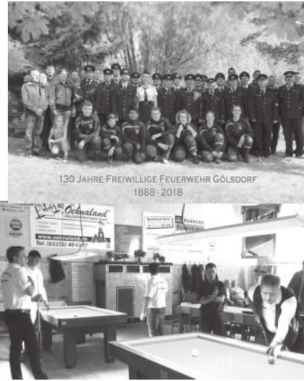
130 JAHRE FREIWILLIGE FEUERWEHR GÖLSDORF 1888-2018