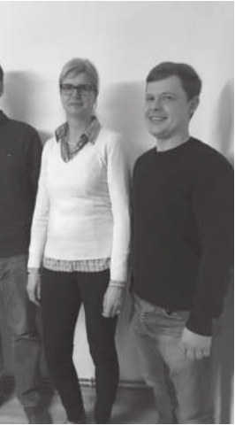
Gründung Schönefelder Heimatverein