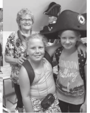
Gemeinderundfahrt mit der Patenklasse