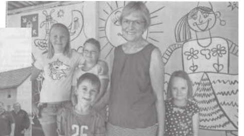
Abschied nach 18 Jahren