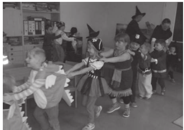
Team der Kita „Lalido“

Wir hatten alle großen Spaß am Feiern und gehen nun in die Faschingspause.