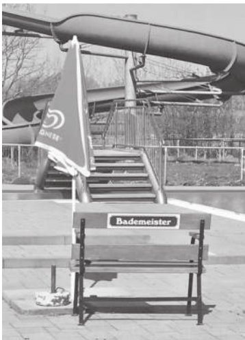
Alles bereit für die Badesaison 2019!

In den Sommerferien (vom 20.06. bis 03.08.2019) öffnet das Freibad von Montag bis Freitag bereits um 11.00 Uhr.