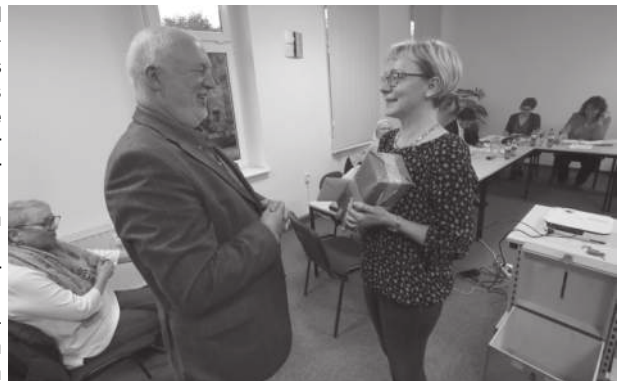
(Teil-)Autor und Foto: MAZ Jüterbog, Uwe Klemens

Das Plus kann der Verband gut gebrauchen, denn auch im kommenden Jahr stehen mit der Weiterführung der B-102-Sanierung und dem grundhaften Ausbau des Waldauer Weges, dem geplanten Baubeginn in der Linden- und Parkstraße, im sogenannten Schulquartier sowie kleineren Maßnahmen in der Dennewitzer Straße, in Bochow und in Langenlippsdorf teure Investitionen ins Haus.