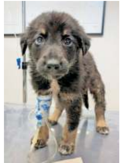
Juri starb als Opfer des Welpenhandels.

Präsident des Deutschen Tierschutzbundes e. V.