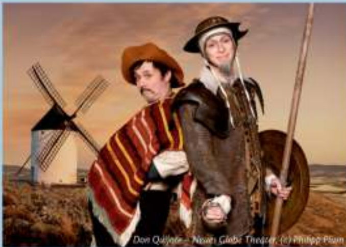
Don Quijote – Neues Globe Theater

Samstag, 14. August 2021, 16.00 Uhr „Die Freiheit, Sancho, ist eine der köstlichsten Gaben...“