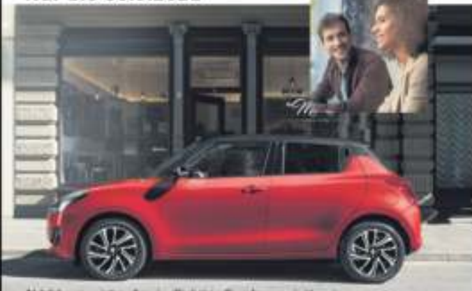
Abbildung zeigt aufpreispflichtige Sonderausstattung.

Macht Sinn, macht Laune. Für 99,- EUR mtl. leasen 1