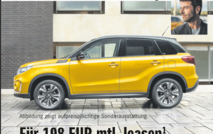
Abbildung zeigt aufpreispflichtige Sonderausstattung.