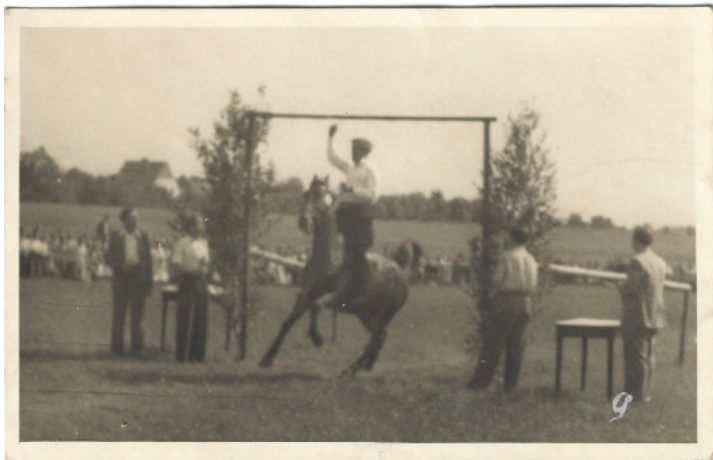
Stollenreiten im Sommer 1951 in Niedergörsdorf. Wer kann nähere Angaben zu diesem Foto machen? Es winkt ein kleiner Preis.

Die Ringe werden mit einer Lanze aufgespießt. Der Durchmesser der Ringe verkleinert sich im Laufe des Wettkampfs.