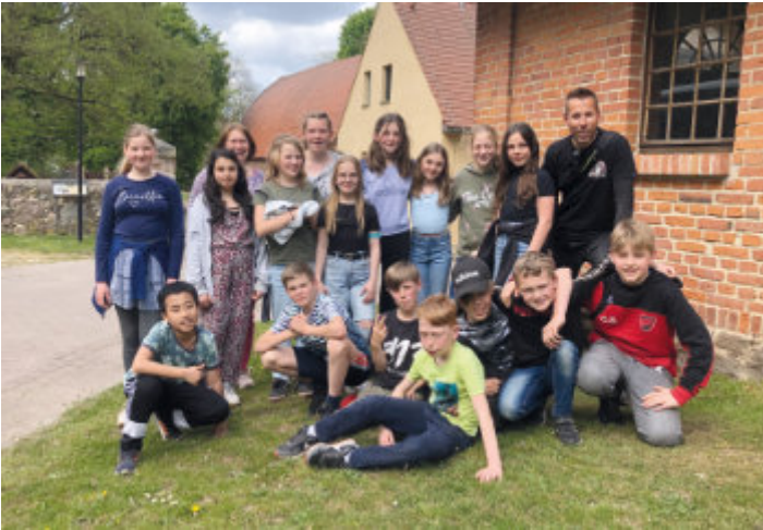
Alle waren sich einig - Das war ein toller Wandertag!

Völlig überrascht erfuhren wir, die Kinder der Klasse 5a der Thomas- Müntzer- Grundschule Blönsdorf, im Februar, dass wir den ersten Platz beim Landeswettbewerb „Landwirtschaft und ländlicher Raum“ belegt hatten.