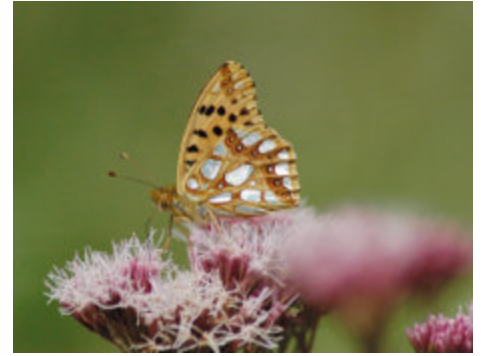
„Ein Kleiner Perlmuttfalter“

flächigen Anbaukulturen leicht verursacht werden können. Er betonte die Anstrengungen, immer mit geringster Anwendungsmenge zu arbeiten und auch nur solche Mittel anzuwenden, die ausschließlich die Schädlingsart treffen sollen. Jedoch schilderte Lehmann an einem Beispiel, wie ihm dabei das eingeschränkte Spektrum der zugelassenen Mittel und die Vielzahl der Anwendungs-Reglementierungen im Wege stehen. Von Seiten der Naturschützer kam die Anregung, die riesigen Ackerschläge zu verkleinern und sie mit Heckenstrukturen zu umgrenzen, in denen sich dann die natürlichen Gegenspieler permanent tummeln können. Weiterhin kam die dringende Forderung, verstärkt solche Insektizide zu entwickeln (und dann auch anzuwenden), die nur das Schadinsekt treffen und nicht die vielen anderen, dort lebenden Insektenarten, wie z.B. die Laufkäfer. Diese haben nicht nur einen sportlichen Namen, sondern sind als „Fleisch-Fresser“ wichtige Gratis-Akteure beim