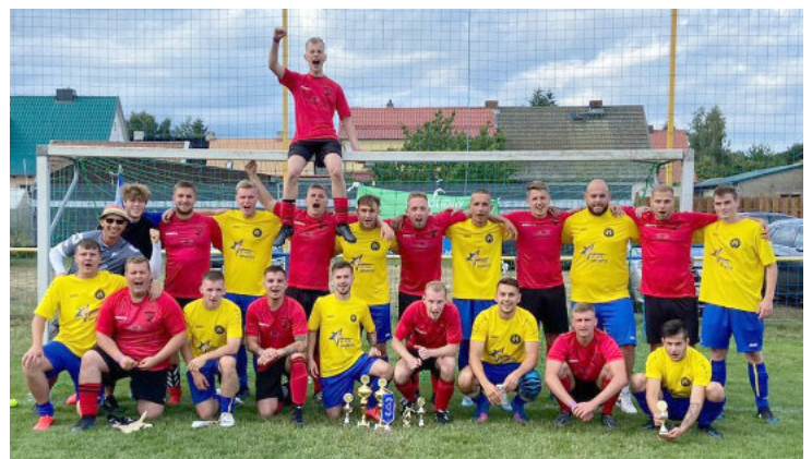
Ein sportlicher Höhepunkt beim eigenen Turnier

Die rund 300 Zuschauer sahen viele Tore, spannende Spiele und packende Zwei-