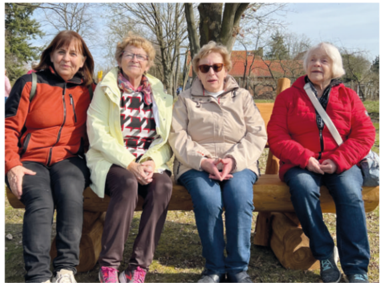
Fröhliche Einweihung der neuen Bank am Spielplatz Mühlenweg

Danke an alle Teilnehmer, im Herbst gibt es den nächsten Spaziergang.