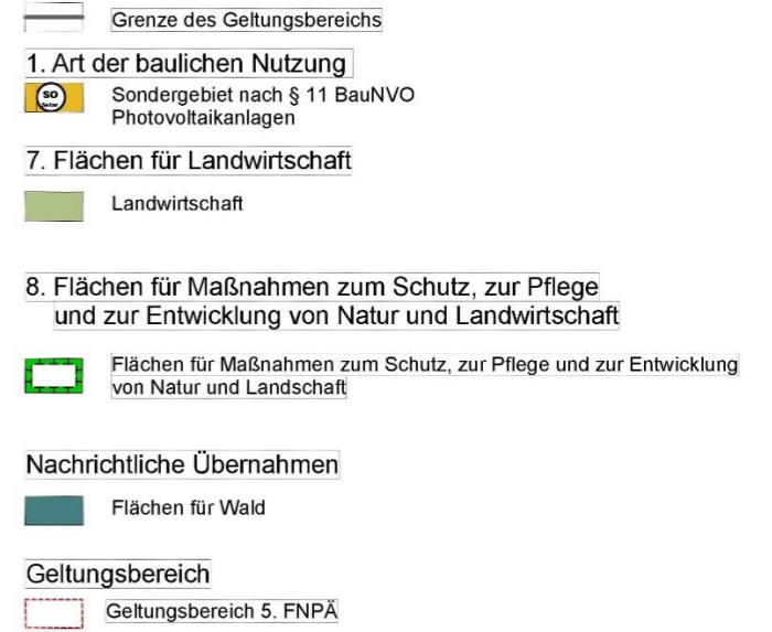
Abbildung 2: Flächennutzungsplandarstellung vorher / nachher