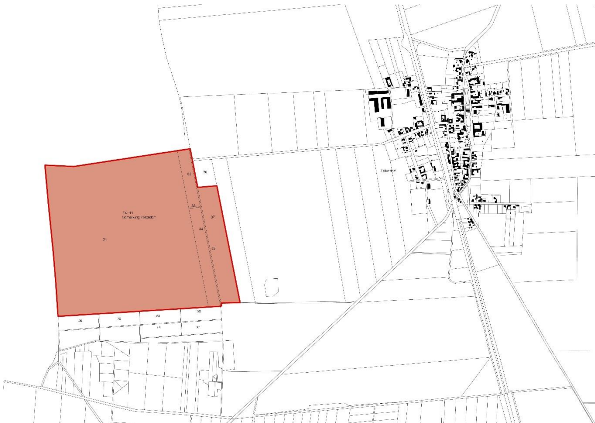
Abbildung 1: Lage des Plangebietes zur Ortslage Zellendorf

Das Plangebiet befindet sich etwa 1,1 km westlich der Ortslage Zellendorf. Es handelt sich um Flächen intensiver Landwirtschaft, die im Süden durch einen Wald begrenzt werden. Der östliche Bereich des Plangebietes wird durch einen Weg in Nord-Süd-Richtung mit begleitender Heckenpflanzung durchzogen. Im Westen, Norden und Osten schließen sich landwirtschaftlich genutzte Agrarflächen an, wobei die westlichen und nördlichen Flächen zum Nachbarlandkreis Wittenberg und damit zum Bundesland Sachsen-Anhalt gehören.